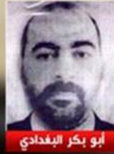
أبو بكر البغدادي