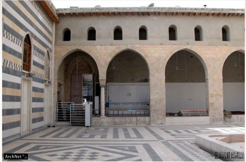
View of courtyard with the wall of the prayer hall seen on the left

على قناطر وكذلك النوافذ القوسية فوق القناطر، بالإضافة إلى شكل ميضأة المسجد القديمة، و توضع مكان المئذنة كما هي مئذنة العروس بالأموي.