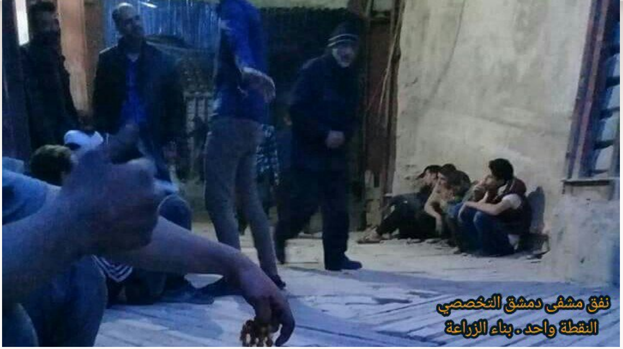
١٥- نفق سارات الإسعاف الذي يمتد إلى داخل مشفى ريف دمشق التخصصي (النقطة واحد) بمدينة دوما في الغوطة الشرقية.