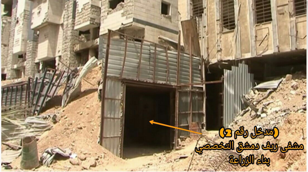
١٣- تظهر في الصورة مشفى ريف دمشق التخصصي (النقطة واحد) المحصنة بشكل كامل، والتي تقع تحت بناء الزراعة قرب دواء الشهداء بمدينة دوما في الغوطة الشرقية.