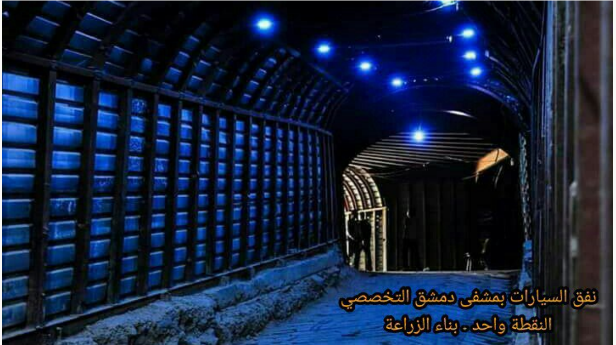
١٦- نفق سيارات الإسعاف الذي يمتد من مشفى ريف دمشق التخصصي (النقطة واحد) إلى أنفاق أخرى بمدينة دوما في الغوطة الشرقية.