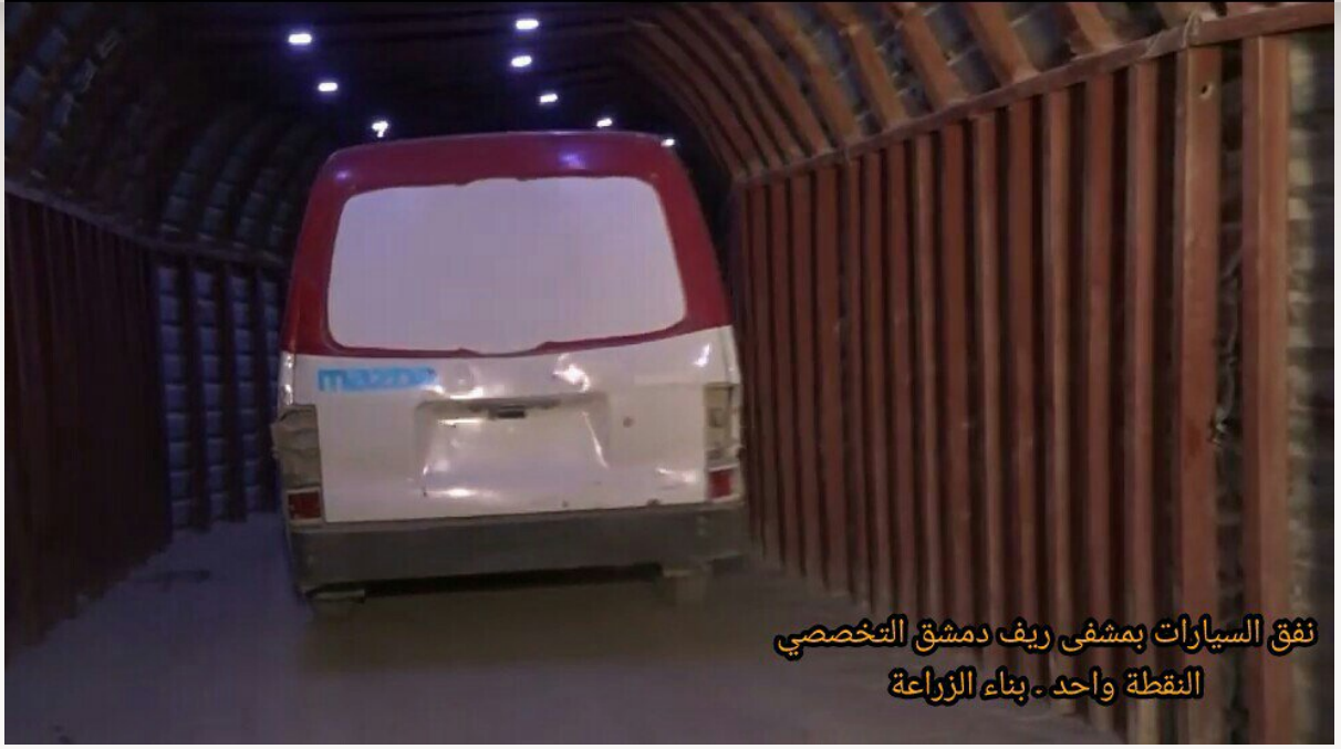
نفق السيارات بمشفى ريف دمشق التخصصي النقطة واحد - بناء الزراعة

١٧- نفق سيارات الإسعاف الذي يمتد من داخل مشفى ريف دمشق التخصصي (النقطة واحد) إلى أنفاق أخرى بمدينة دوما في الغوطة الشرقية.