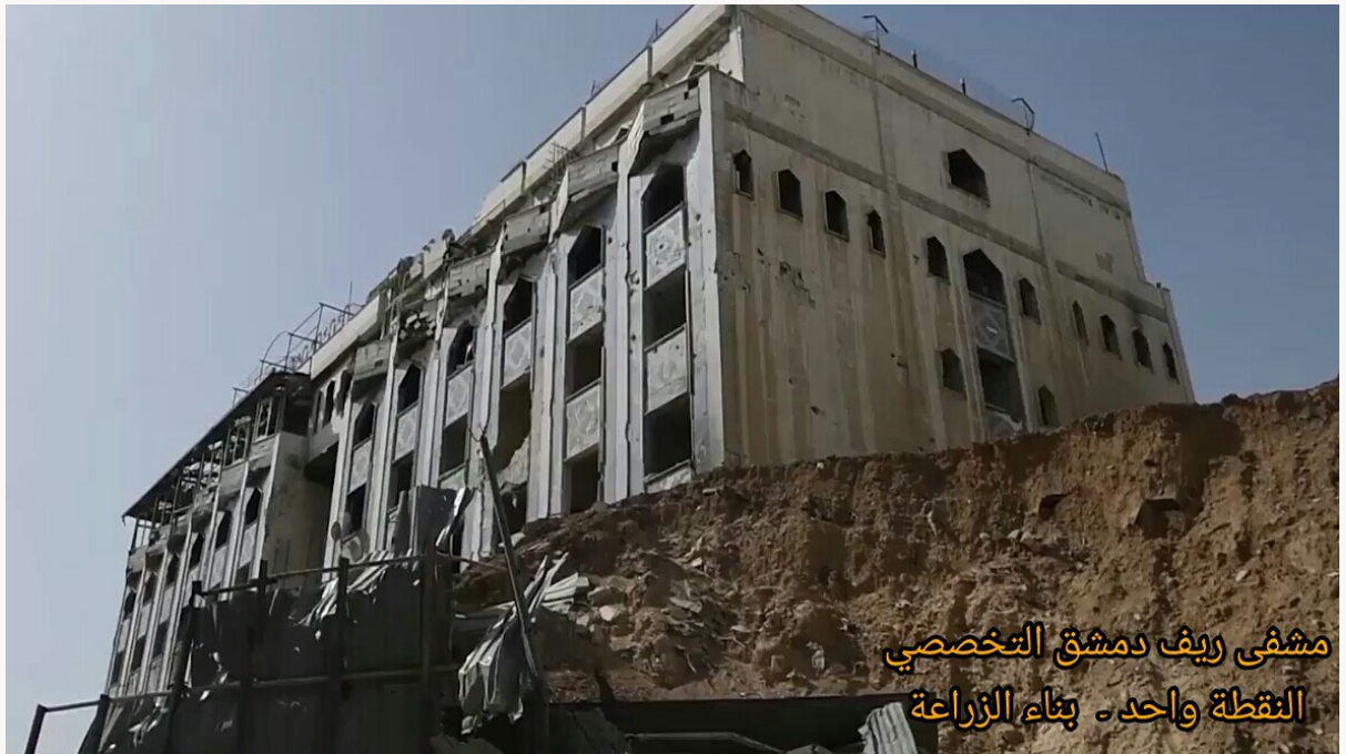
١٤- مدخل النفق الذي يمتد إلى داخل مشفى ريف دمشق التخصصي (النقطة واحد) بمدينة دوما في الغوطة الشرقية.